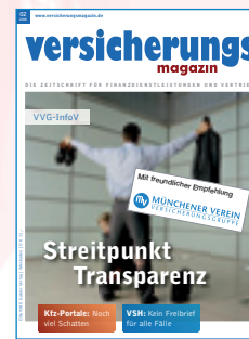
Unfallschutz UNIKAT Produkt des Monats 02/2008

TIPP Experten der Stiftung Warentest bewerten eine private Unfallversicherung als sinnvoll. Sie empfehlen eine hohe Versicherungssumme bei hoher Invalidität. Quelle: Stiftung Warentest Online